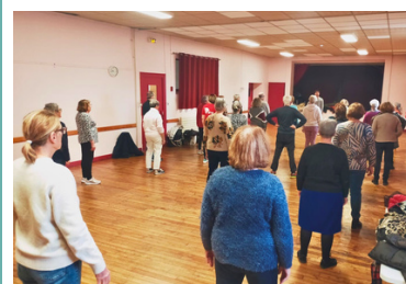
20 janvier Sportez-vous bien ! Par David Vicard