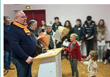
16 janvier Vœux municipaux