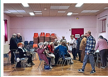
13 janvier Assemblée Générale Villedoux Seniors